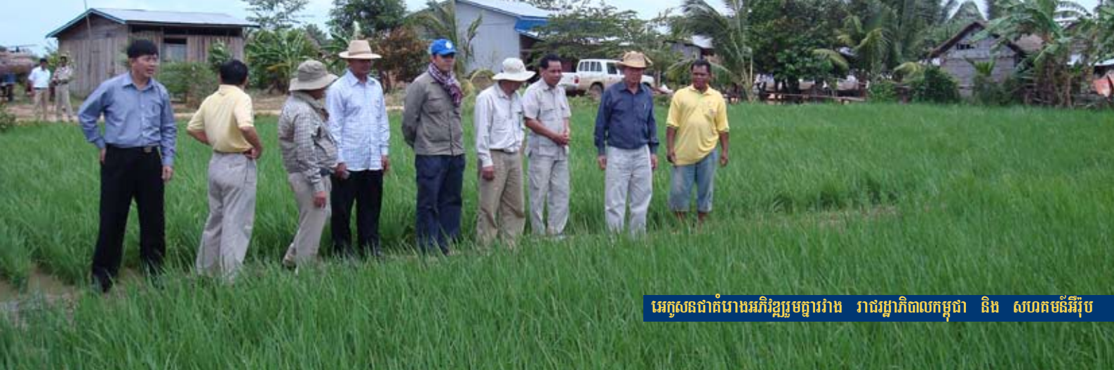
អេកូសនជាតំណាងអភិវឌ្ឍន៍មធ្យមរវាង រាជរដ្ឋាភិបាលកម្ពុជា និង សហគមន៍អឺរ៉ុប

អេកូសនចូលរួមកាត់បន្ថយភាពក្រីក្រ តាមរយៈការអភិវឌ្ឍជនបទចម្រុះ ការពង្រឹងវិស័យកសិកម្ម បសុសត្វ និង ជលផល ការធ្វើប្រពលវប្បកម្ម និង ពិពិធកម្ម លើប្រព័ន្ធបរិកម្មតំបន់ទំនាបអាស្រ័យទឹកភ្លៀង អាស្រ័យស្រោចស្រព និង តំបន់ខ្ពង់រាប ការអភិវឌ្ឍអង្គការអ្នកបង្កើនផល-កសិករ ការអភិវឌ្ឍប្រព័ន្ធស្រោចស្រព កែលម្អអរដ្ឋវដ្តជួល ការប្រើប្រាស់ ទឹកស្អាត ការទទួលបានឥណទានកាន់តែប្រសើរ ការផ្តល់វិស័យសេវាសហគមន៍ ការអភិវឌ្ឍខ្សែសង្វាក់ផលិតកម្មបន្លែ ផ្លែឈើ និង ដំណាំផ្សេងៗ ការផ្តល់កម្មសិទ្ធិដីធ្លី និងការពោសសំអាតគ្រាប់មីន ការធ្វើយន្តការការផ្សព្វផ្សាយអំពីគ្រាប់មីន យុទ្ធភណ្ឌមិនទាន់ផ្ទុះ កាំភ្លើងខ្លី និង សេវាកម្មផ្សេងទៀត។